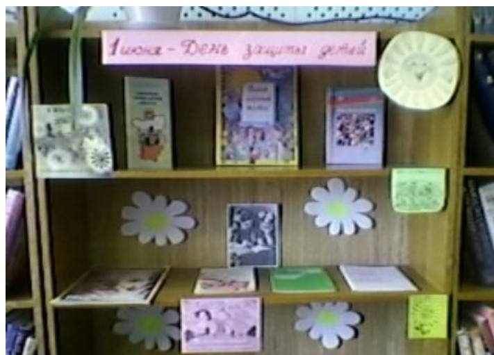
Выставка ко Дню защиты детей