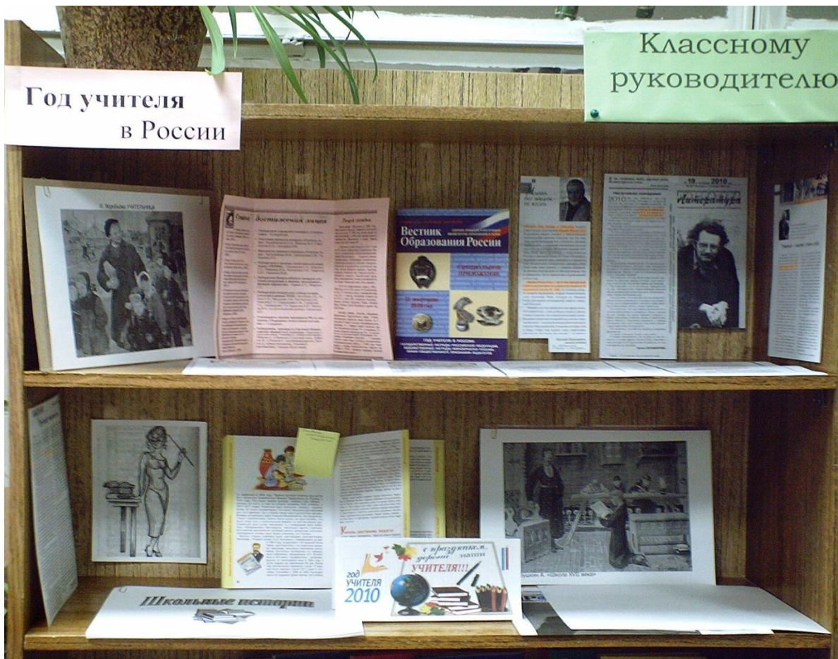
Книжная полка «Год учителя в России»