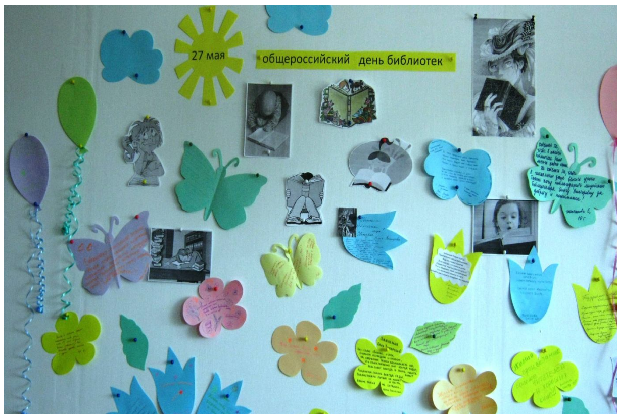
«Мои пожелания библиотеке»- стенд к празднику библиотек