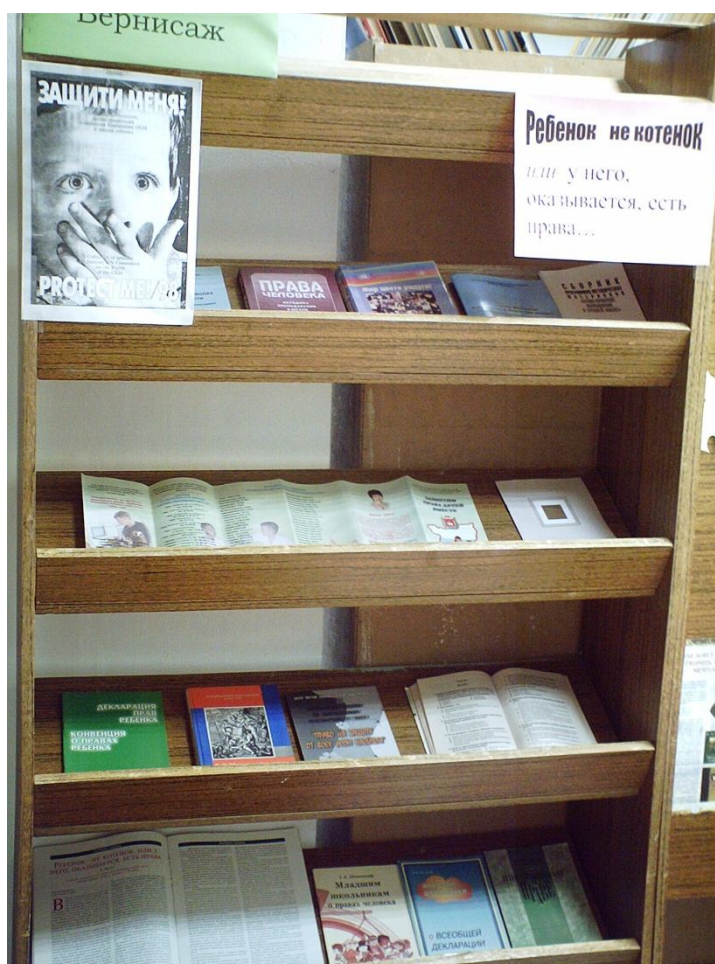
Выставка по правам ребенка