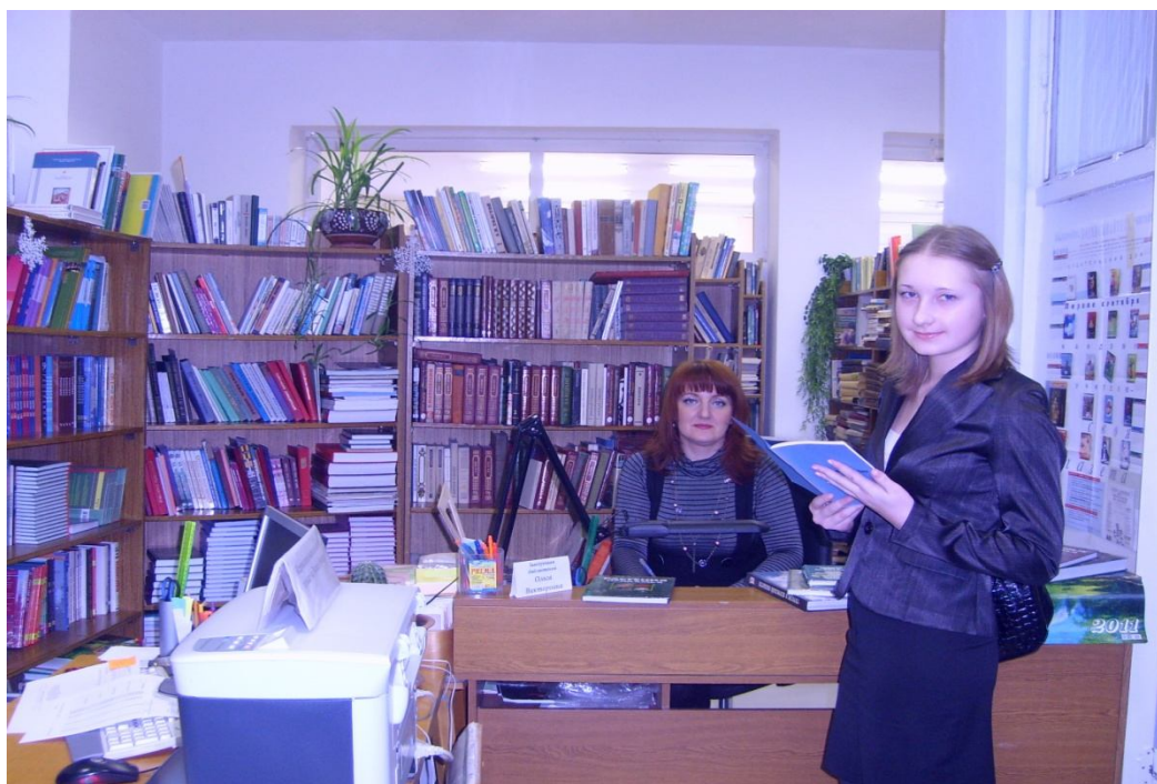
В библиотеке лица